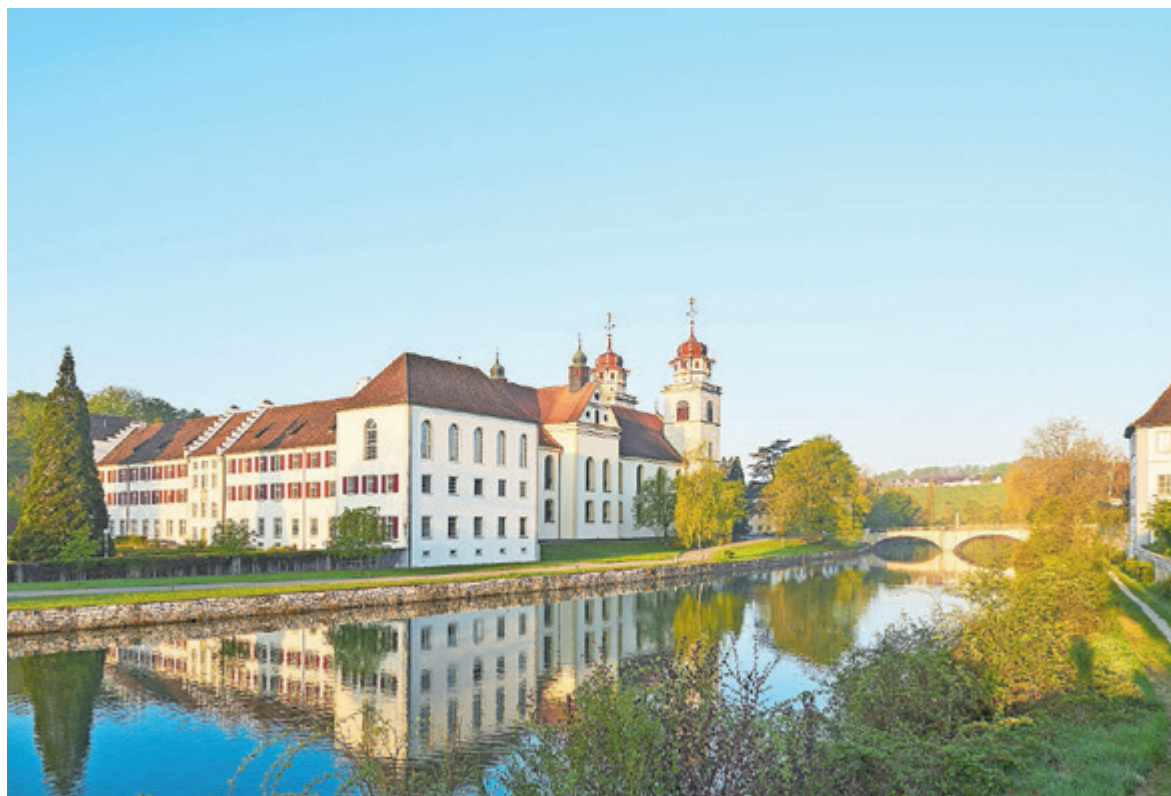
Idyllisch gelegen – das Musikprobezentrum Musikinsel Rheinau

ESTA-Wochenende 16./17. September 2017, im Kulturhaus West, 4800 Zofingen